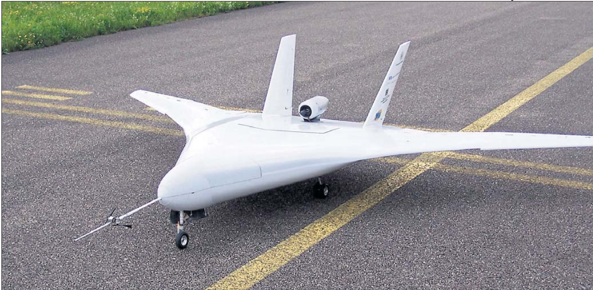
Trotz der nur 3,3 Meter Spannweite und 24,5 Kilogramm Gewicht ist Vela 2 ein veritabler Jet. Zwar lässt sich die Zufriedenheit von Passagieren mit diesem neuen Modell aus Stuttgart nicht testen, wohl aber das Flugverhalten einer solchen spritsparenden Rumpfform.