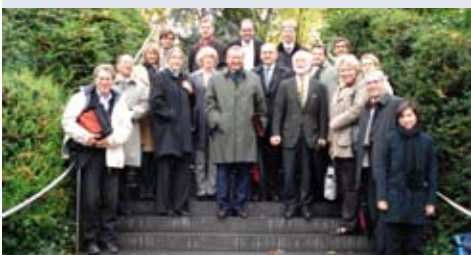
Gruppenbild mit Treppe: Die Georgsmarienhütte Holding GmbH empfing die Mitglieder des Kommunikationskreises