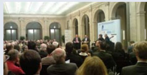
Vier Experten, darunter zwei Vertreter von acatech, diskutierten auf dem ZEIT-Forum über die Mobilität der Zukunft.

Vor den rund 150 Zuhörern der Veranstaltung,