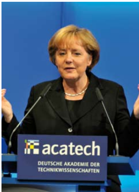
„Es ist gut geworden“: Bundeskanzlerin Angela Merkel würdigte in ihrer Rede den Aufstieg von acatech zu einer nationalen Akademie.