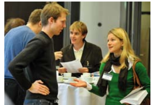
Szene aus der Pause