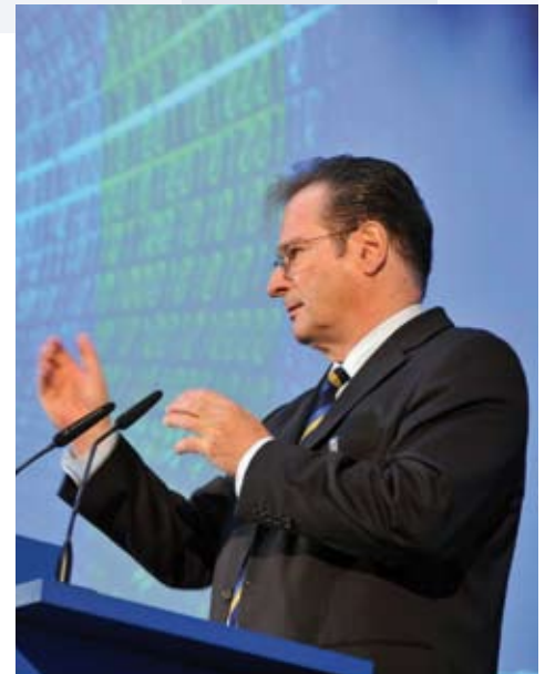
Klaus Kinkel, Vorsitzender Deutsche Telekom Stiftung und ehemaliger Bundesaußenminister, war einer der Redner des Symposiums.

www.acatech.de/produktionsfaktor-mathematik