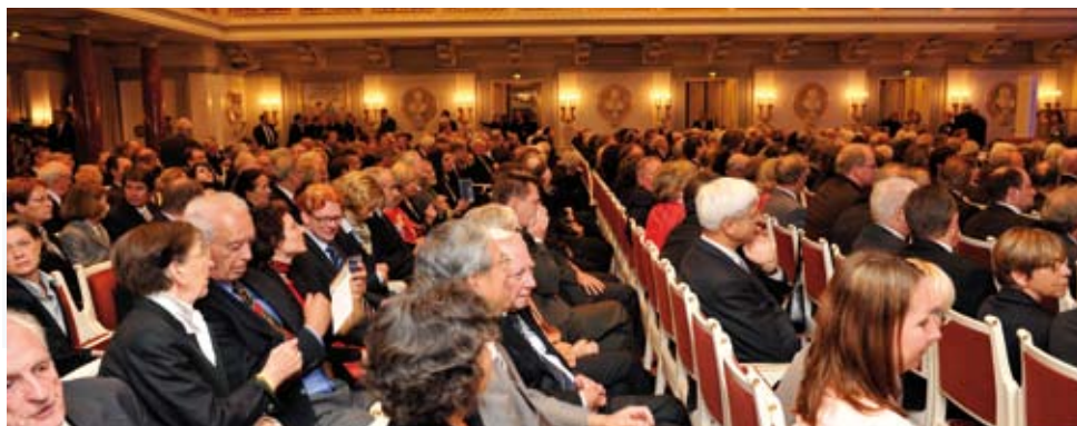
Die Reihen gut gefüllt: Eindruck aus dem Konzerthaus am Gendarmenmarkt